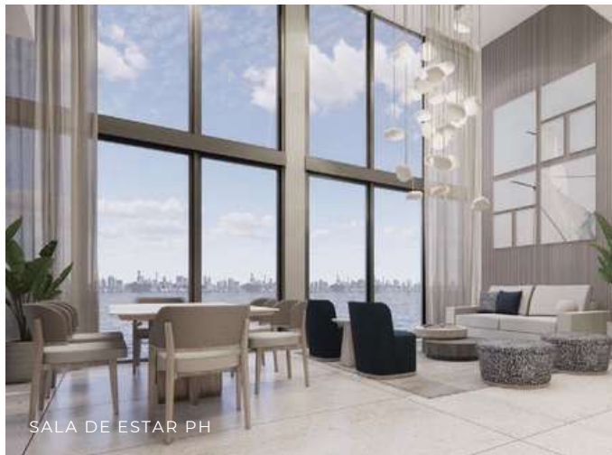
SALA DE ESTAR PH