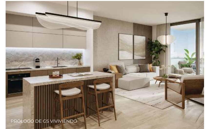
PRÓLOGO DE GS VIVIENDO

Todas con impresionantes vistas del horizonte de la ciudad y la bahía. Cada unidad cuenta con acabados de alta gama y electrodomésticos modernos, lo que la convierte en el hogar perfecto para aquellos que buscan lujo y comodidad.